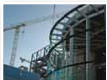
Construcción & Mantenimiento edificio